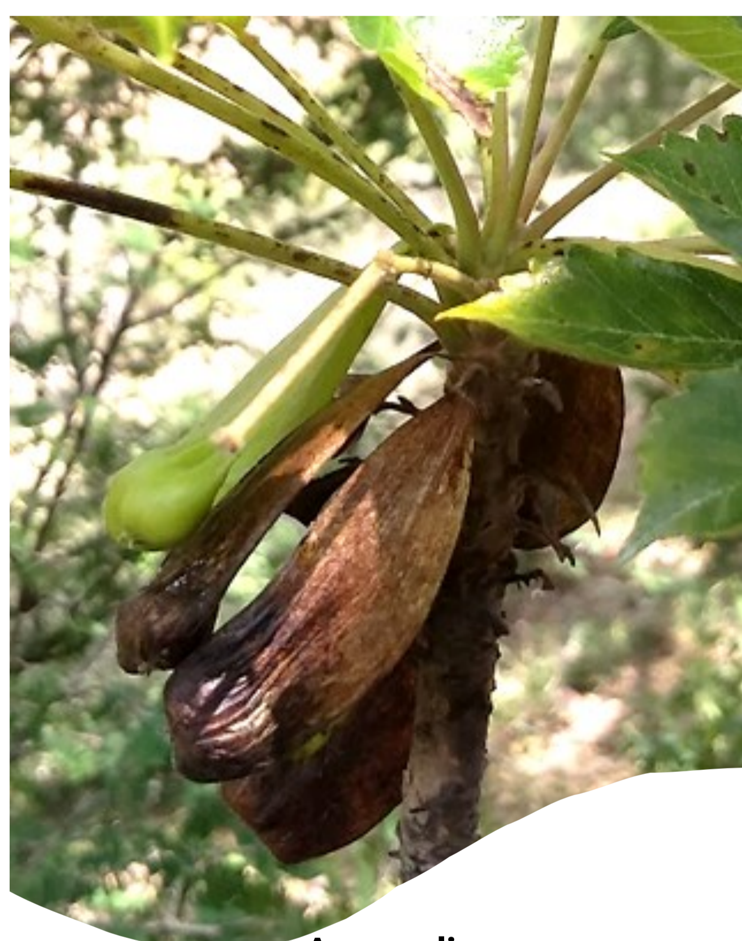
Anacardiaceae Amphipterygium adstringens

Pan Totlaltipak Yaotl noso Guerrero "motekitiltia kuak kektlalia yestli"