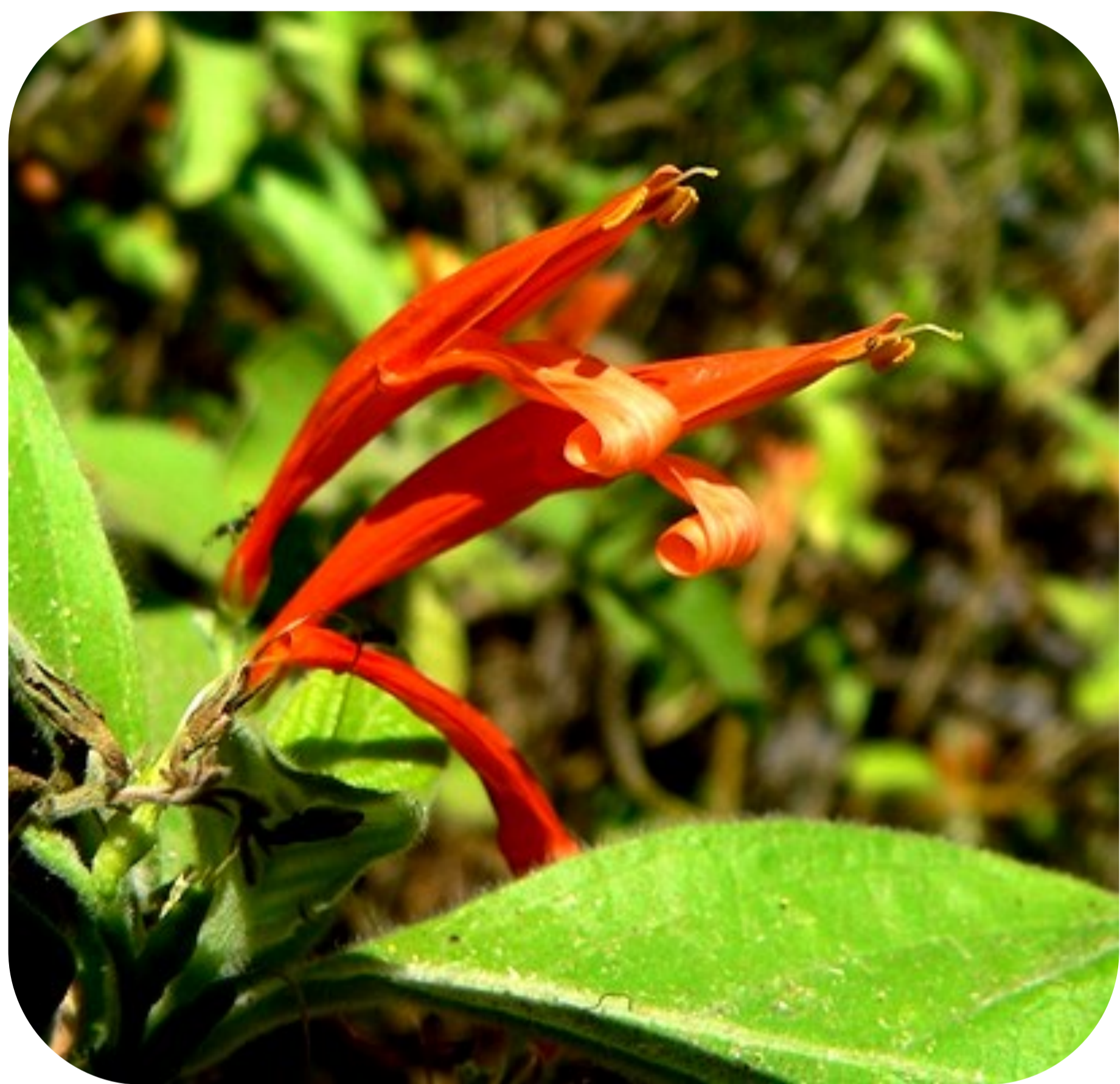
Acanthaceae Justicia spicigera

Xiujkojtlan motekitiltiaj kuak kipajtiaj se kokolistli pan se naseualli noso kuak tlatle kikokoua kej ama moixinekuiloua uan okseki, noijki kintekitiltiaj panpa maka kimajsis se kokolistli saniman konij se xiuitl.