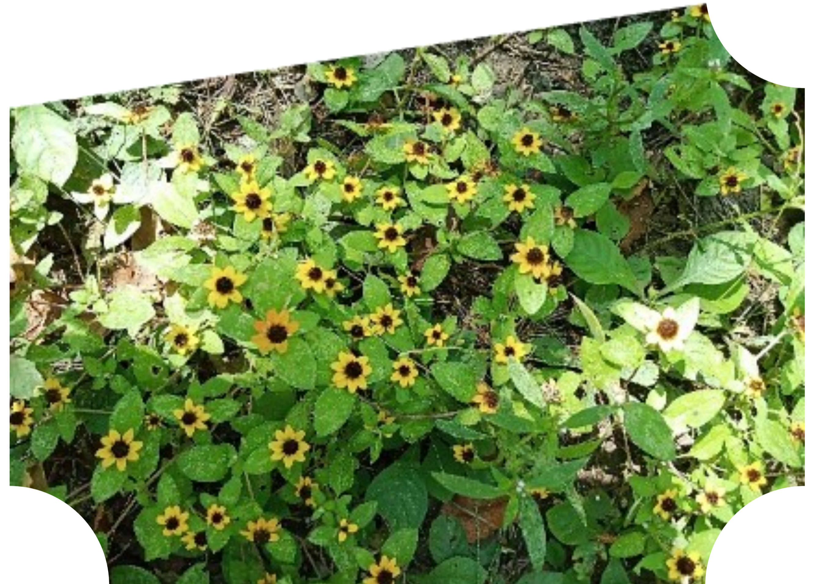
Asteraceae Sanvitalia procumbens

Kijtota in Organización Mundial de la Salud (OMS, 2023), nelli miyek pajmej okinchijchijkej ika xiujkojtlan kanaj kiliaj ome poualli % noso 40% kipiaj xiujkojtlan uan noijki yauejka tlapajtikej nochi tlen okimatiaj ika xiujkojtlan tlapajtikej ika okinchijchijkej pajmej. Nikan techonititiaj in pajmej uan tlenon intoka uan ika omochijchijkej kej aman in kitokayotiaj aspirina okixitijkej itech kojtlit itoka Sauce, uan on pajtli uan mitspaleuis panpa xoktikinpias mokoneuan okixitikej itech on ineluyo kamojtli uan chanti pan tepetl.